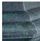
Vert de gris

Pour visualiser la gamme complète des finis et des panneaux de verre Snoc, visitez notre site au www.snocinc.com